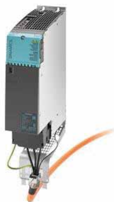
Modulo da 45 e 60 A